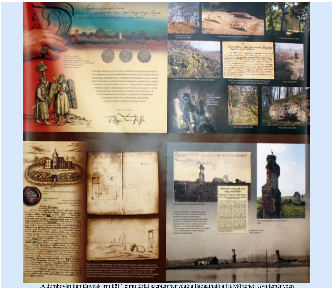
„A dombóvári kapitányak írnői köll” című tárlat szeptember végéig látogatható a Helytörténeti Gyűjteményben